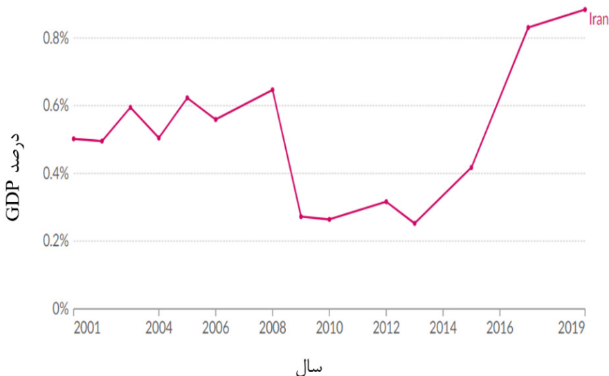
نمودار ۳- هزینه‌کرد تحقیق و توسعه در ایران (درصد GDP)

براساس یک مطالعه در ایران، میانگین ضریب تحقیق و توسعه در صنایع با فناوری پیشرفته بالاتر از میانگین سایر صنایع است. این امر نشان‌دهنده این واقعیت است که سرمایه‌گذاری در تحقیق و توسعه این صنایع می‌تواند به‌طور قابل توجهی بهره‌وری کل عوامل تولید صنعت را افزایش دهد. بالاترین ضریب تحقیق و توسعه به صنعت وسایل نقلیه موتوری اختصاص دارد و پس از آن، صنعت ماشین‌آلات و دستگاه‌های الکتریکی قرار گرفته است. همچنین، صنعت خودروسازی ایران که پس از صنعت نفت و گاز، دومین صنعت بزرگ کشور به حساب می‌آید، حدود ۱۰ درصد از تولید ناخالص داخلی را به خود اختصاص داده است. در میان صنایع پیشرفته، تولید محصولات دارویی نیز