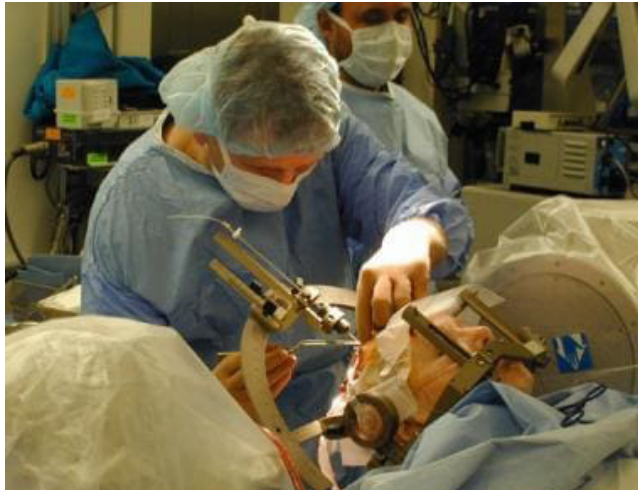
تصویر ۳- کاشت لید تحریک عمیق مغز (DBS)

DBS تالاموس در بیماران مبتلا به ترمور عمدتاً شدید و ناتوان کننده، استفاده شده است. با این حال، این جراحی در حال حاضر به ندرت در بیماران مبتلا به بیماری پارکینسون استفاده می‌گردد، زیرا نشان داده شده که سایر علایم همچنان در حال پیشرفت هستند و باعث ناتوانی قابل توجهی می‌شوند که توسط DBS تالاموس کنترل نمی‌گردد. مطالعات برجسته اخیر اثربخشی DBS STN و GPI را برای بیماران مناسب مبتلا به بیماری پارکینسون نشان داده‌اند. در یک کارآزمایی تصادفی و کنترل شده روی ۲۵۵ بیمار ثبت نام شده در کارآزمایی (the Veterans Affairs (VA) Cooperative Studies Program (CSP) } برای بیماران مبتلا به بیماری پارکینسون پیشرفته، DBS دوطرفه (GPI و STN) موثرتر