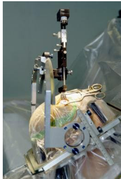
تصویر ۴- قرار گیری یک الکتروود در هنگام تحریک عمیق مغز برای بیماری پارکینسون

DBS تالاموس در بیماران مبتلا به ترمور عمدتاً شدید و ناتوان کننده، استفاده شده است. با این حال، این جراحی در حال حاضر به ندرت در بیماران مبتلا به بیماری پارکینسون استفاده می‌گردد، زیرا نشان داده شده که سایر علایم همچنان در حال پیشرفت هستند و باعث ناتوانی قابل توجهی می‌شوند که توسط DBS تالاموس کنترل نمی‌گردد. مطالعات برجسته اخیر اثربخشی DBS STN و GPI را برای بیماران مناسب مبتلا به بیماری پارکینسون نشان داده‌اند. در یک کارآزمایی تصادفی و کنترل شده روی ۲۵۵ بیمار ثبت نام شده در کارآزمایی (the Veterans Affairs (VA) Cooperative Studies Program (CSP) } برای بیماران مبتلا به بیماری پارکینسون پیشرفته، DBS دوطرفه (GPI و STN) موثرتر