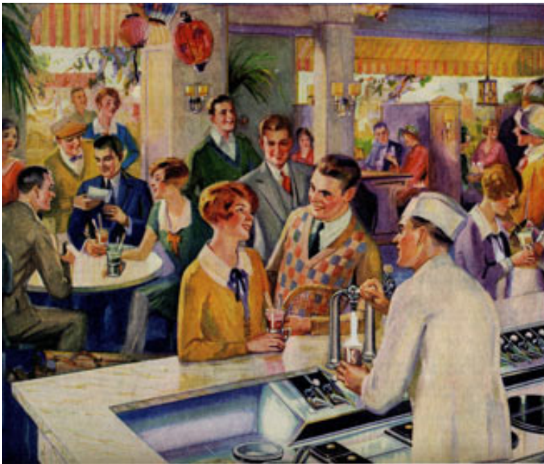
تصویر ۱- نمایی از داروخانه‌ها در دوره ارایه نوشیدنی‌های گازدار، ۱۹۵۰

سال ۱۹۶۰ به‌طور کامل داروخانه خود را به یک "مرکز دارویی" تبدیل کرد، جایی که دیگر اثری از دستگاه نوشابه ساز و ارایه هدیه و اسباب‌بازی و دستگاه آب نبات چوبی نبود. او در داروخانه جدید خود سیستم ثبت و پیگیری نسخه خانواده را راه‌اندازی کرد، یک شخص به‌عنوان پذیرش در داروخانه خود قرار داد تا به بیماران خوشامد بگوید و یک فضای نیمه خصوصی برای انجام مشاوره با بیماران آماده کرد (۶).