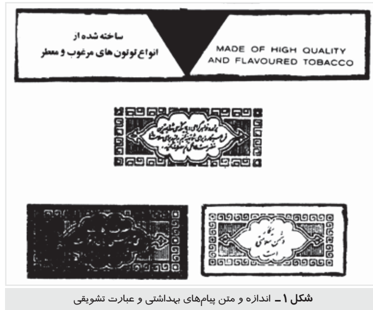
شکل ۱- اندازه و متن پیام‌های بهداشتی و عبارت تشویقی

تصمیم‌گیرنده به لزوم و حقانیت مبارزه با آثار زیانبار دخانیات و انجام بعضی اقدامات متقاعد گردند. یکی از مواردی که در برنامه‌های آموزشی باید به آن تکیه شود زبان‌های مصرف دخانیات است.