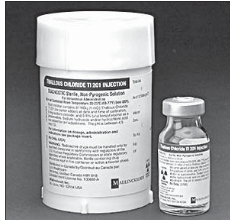
شکل ۱ کیت تجاری MIBI

ایسکمیک (نواحی با جریان خون کم) یا اسکار (بافت مرده قلب) به دست می‌آید که کمک به درمان به موقع و جلوگیری از پیشرفت بیماری‌های قلبی - عروقی خواهد کرد.