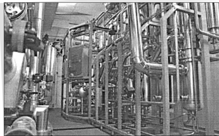
شکل ۲: تولید آب تزریقی با روش تقطیر چند مرحله‌ای

اساساً در صنایع داروسازی از روش تقطیر چندمرحله‌ای برای تهیه آب مقطر تزریقی استفاده می‌شود. آب مقطر با کیفیت بالا از طریق تبخیر و تقطیر متوالی در ستون‌های مربوط تهیه می‌شود. آب ورودی خالص