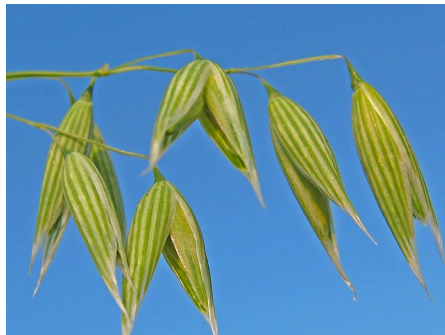
شکل ۱- دانه جو دو سر ( https://en.wikipedia.org/wiki/Oat )

یولاف یا جو دو سر (oats)، با نام علمی Avena sativa گیاهی است از خانواده گندمیان (شکل ۱)، این گیاه در تمام دنیا از جمله ایران (استان‌های مرکزی، لرستان، فارس و