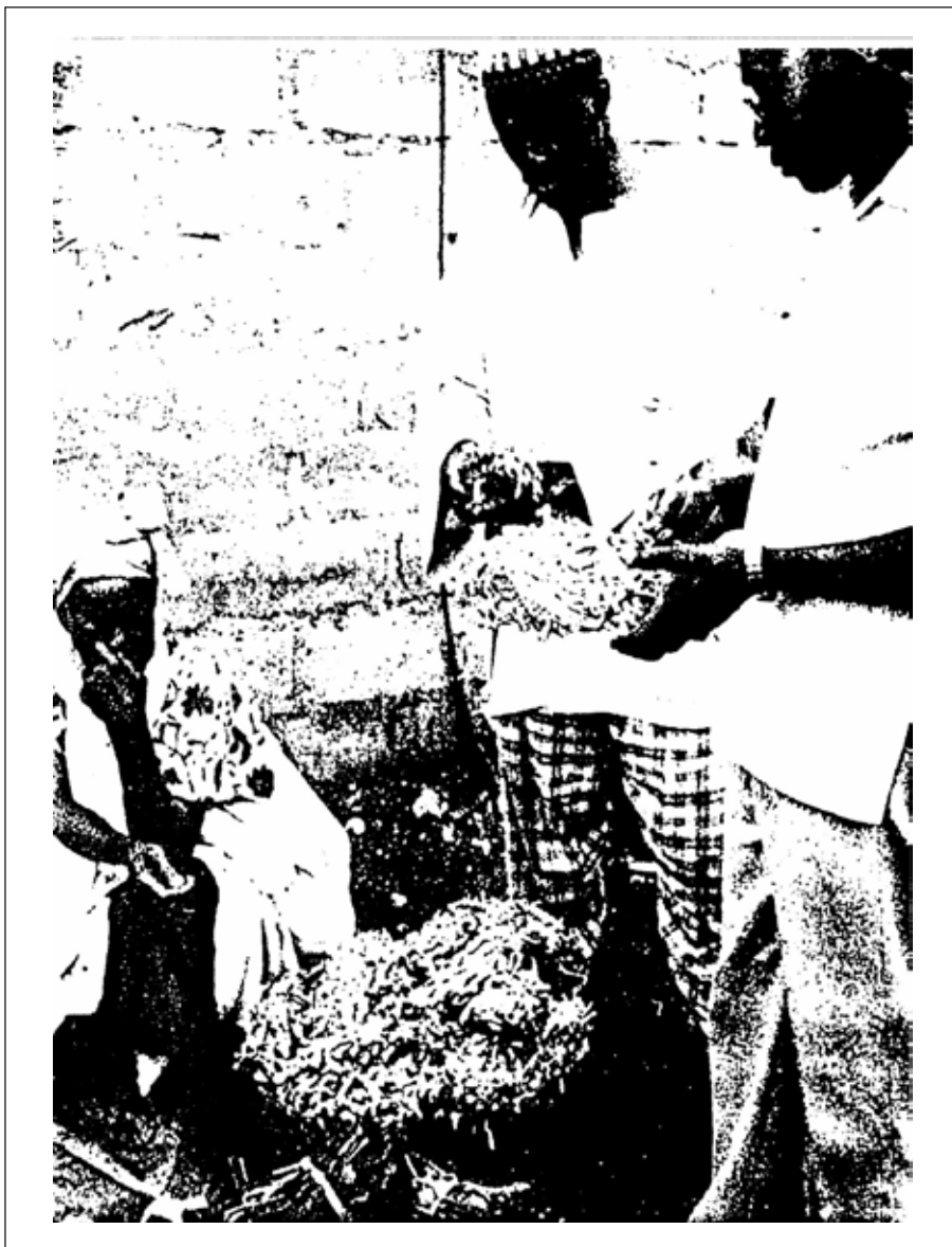
پیوست ۱ - کنترل گیاهان دارویی در بازارهای محلی توسط بازرسان وزارت بهداشت