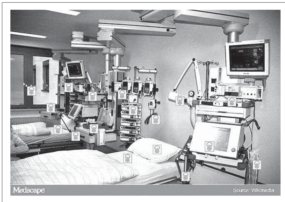
شکل ۱ - سطوح با تماس زیاد بالقوه آلوده در محیط بیمار

سطوح با تماس زیاد، اشیاء یا سطوحی در نواحی مراقبت بیمار هستند که اغلب توسط کاربران مختلف مورد استفاده قرار می‌گیرند که موجب آلوده‌تر شدن آن‌ها می‌گردند. کمیته مشورتی نظارتی بر کنترل عفونت و مراکز کنترل و پیشگیری از بیماری‌ها ضدعفونی کردن سطوح با تماس زیاد را بیشتر از سایر سطوح توصیه می‌کنند (شکل ۱).